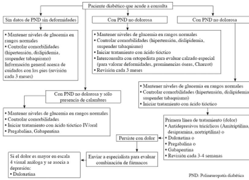
Algoritmo para el manejo del paciente con polineuropatía diabética